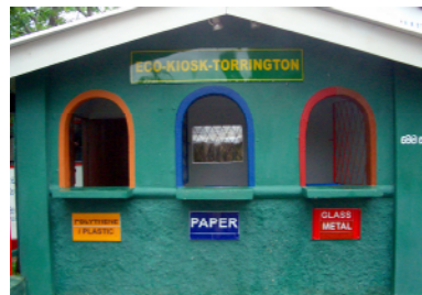
エコキオスク(資源ごみ回収所)