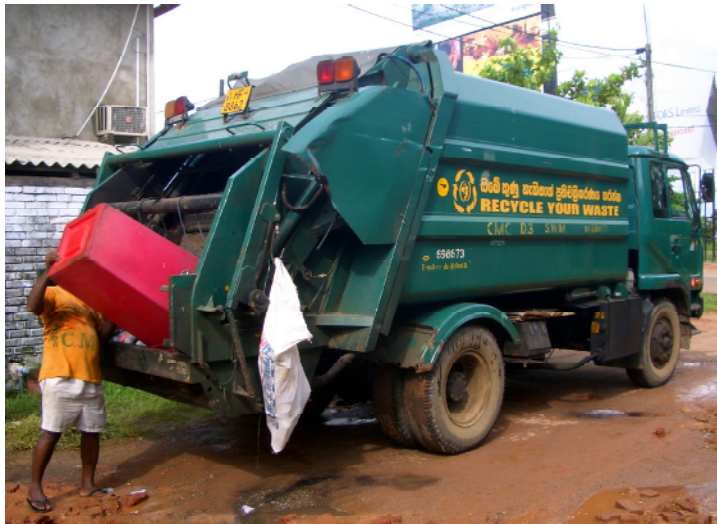
ごみ収集車 リサイクルを呼びかける表示つき。