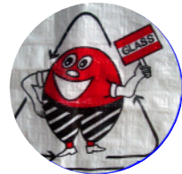
分別回収用ごみ袋