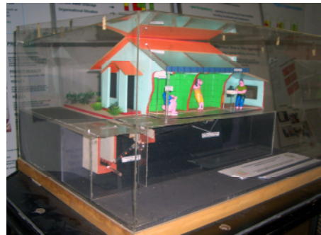
下水道の仕組みに関する展示

最近では、いくつかの工業団地や住宅団地でも下水道管や小規模な下水処理場が建設され、汚水をできるだけきれいな水にもどして川や運河に放流しています。