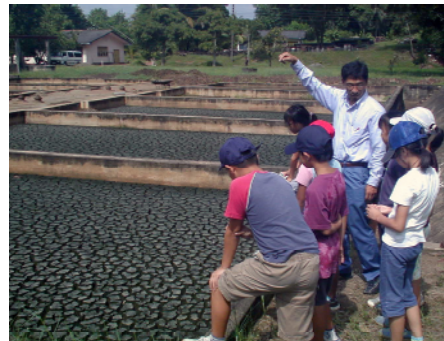
ピヤガマ下水処理場