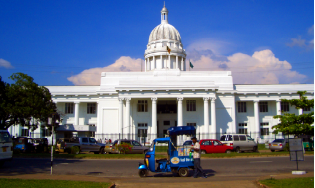
1928年に完成したタウンホール。