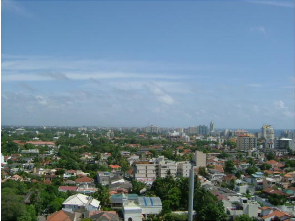
2 コルピティア地区より南を見る