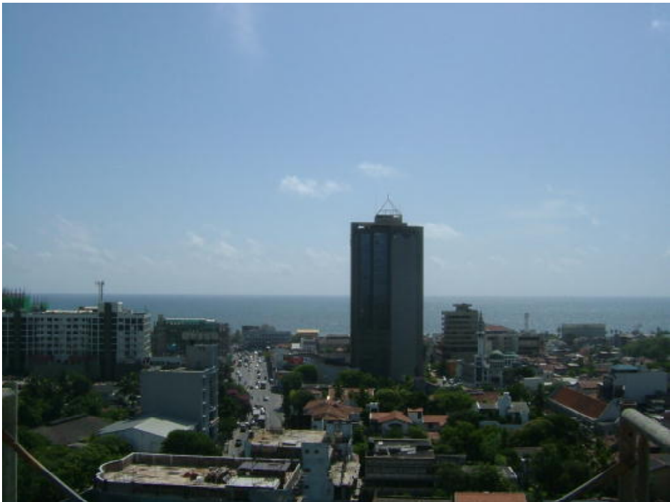
3 コルピティア地区より西を見る